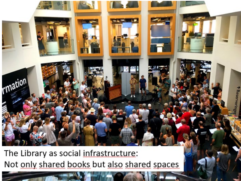
The Library as social infrastructure: Not only shared books but also shared spaces

ห้องสมุดเป็นสถานที่แบ่งปัน ทั้งด้านการใช้พื้นที่ การจัดกิจกรรม การบริการทรัพยากร และการเชื่อมโยงผู้คน บุคลากรห้องสมุดไม่ตัดสินผู้เข้ามาใช้และไม่มีอำนาจที่เป็นทางการ พวกเขาจึงปฏิบัติต่อผู้ใช้ทุกคนเหมือนกันโดยไม่สนใจว่าใครจะร่ำรวยหรือยากจน ใครจะสอบได้คะแนนสูงหรือต่ำ พวกเขาอยู่ที่นี้เพื่อช่วยให้ผู้ใช้บริการสามารถทำงานได้ตามที่ต้องการจนสำเร็จ