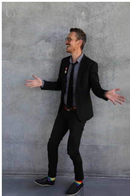
คริสเตียน ลอเออร์เซน (Christian Lauersen) .....

แปลเก็บความบางส่วนจากการบรรยายของเขา เรื่อง “ที่ว่างไม่ใช่แค่ที่ว่าง ห้องสมุดในฐานะที่เป็นพื้นที่แบ่งปัน และเหตุผลที่ห้องสมุดมีความสำคัญต่อชุมชน” (A room is not just a room: The library as shared place and why it matters to communities) ในการประชุมประจำปี CILIPS Conference เมืองดันดี สก็อตแลนด์ เมื่อวันที่ 4 มิถุนายน 2019 ซึ่งเรียบเรียงเป็นบทความฉบับเต็มอยู่ใน https://bit.ly/2PKdP9x ชมสไลด์ประกอบการบรรยาย ได้ที่ https://bit.ly/3mgYKs3 รายละเอียดการประชุม CILIPS ดูที่ https://bit.ly/31z5jgd